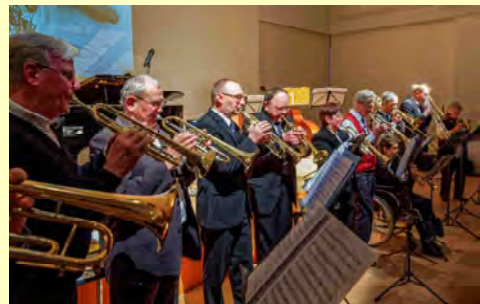
Bilder: Jürgen Meusel und Wolfgang Fuchs