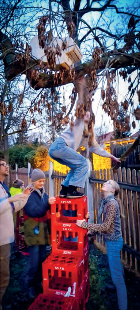
Schatz auf einem Baum