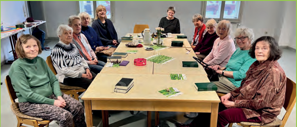
Gemeindenachmittag im Januar