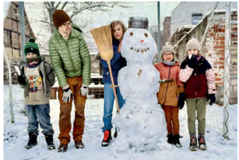
Schneemann der kleinen KiKi-Gruppe

Wir suchen Verstärkung. Komm zur Kinderkirche, denn mit Freunden ist das Spielen, Bibelgeschichten entdecken, Basteln und Beten noch schöner.