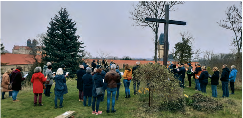
Ostersonntag 2024 auf dem Wipertfriedhof