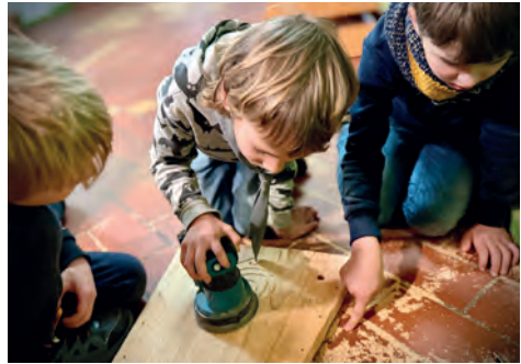
Arbeiten am Turmfalken-Nistkasten

Komm gerne auch früher oder bleib noch etwas länger im Gelände der Haltestelle.