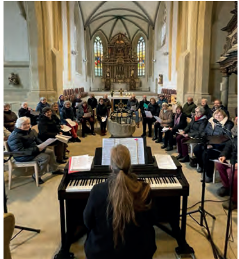
Gemeindechorprobe in der Nikolaikirche