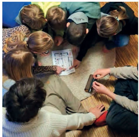
Schatz suchen mit geheimen Schriftrollen