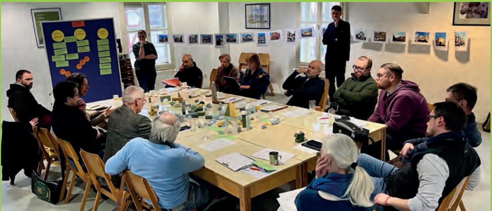
Gebäudeklausur des GKR im Januar 2026